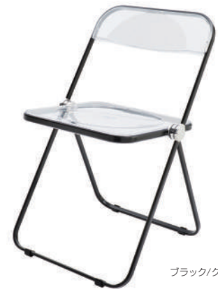
ブラック / クリア