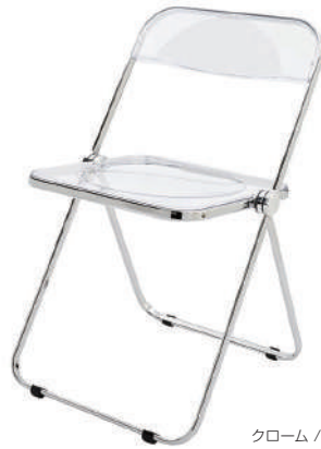
クローム / クリア