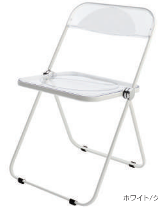
ホワイト / クリア