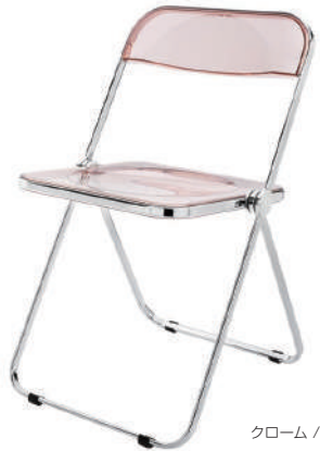
クローム / スモークピンク