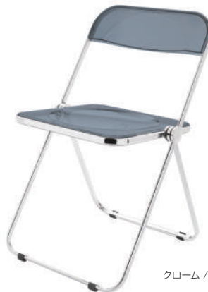
クローム / スモークブラック