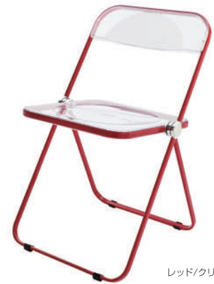
レッド / クリア